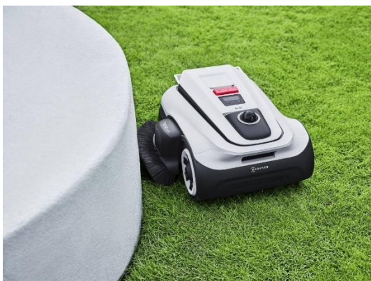
TrueEdge Trimmer: Integriran obrezovalnik za robove

GOAT A1600 LiDAR PRO z integriranim trimmerjem TruEdge zagotavlja resnično avtonomno košnjo. Zagotavlja absolutno pokritost robov in popolnoma odpravlja potrebo po ročnem delu. Nič več dolgočasnih popravkov z ročnimi trimmerji za travo! Trimer TruEdge avtomatizira natančno obrezovanje robov – kar zagotavlja povsem urejeno trato brez napora.