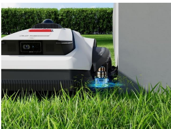
TruEdge: Popolnoma avtomatizirano obrezovanje robov z umetno inteligenco

GOAT A1600 LiDAR PRO z integriranim trimmerjem TruEdge zagotavlja resnično avtonomno košnjo. Zagotavlja absolutno pokritost robov in popolnoma odpravlja potrebo po ročnem delu. Nič več dolgočasnih popravkov z ročnimi trimmerji za travo! Trimer TruEdge avtomatizira natančno obrezovanje robov – kar zagotavlja povsem urejeno trato brez napora.